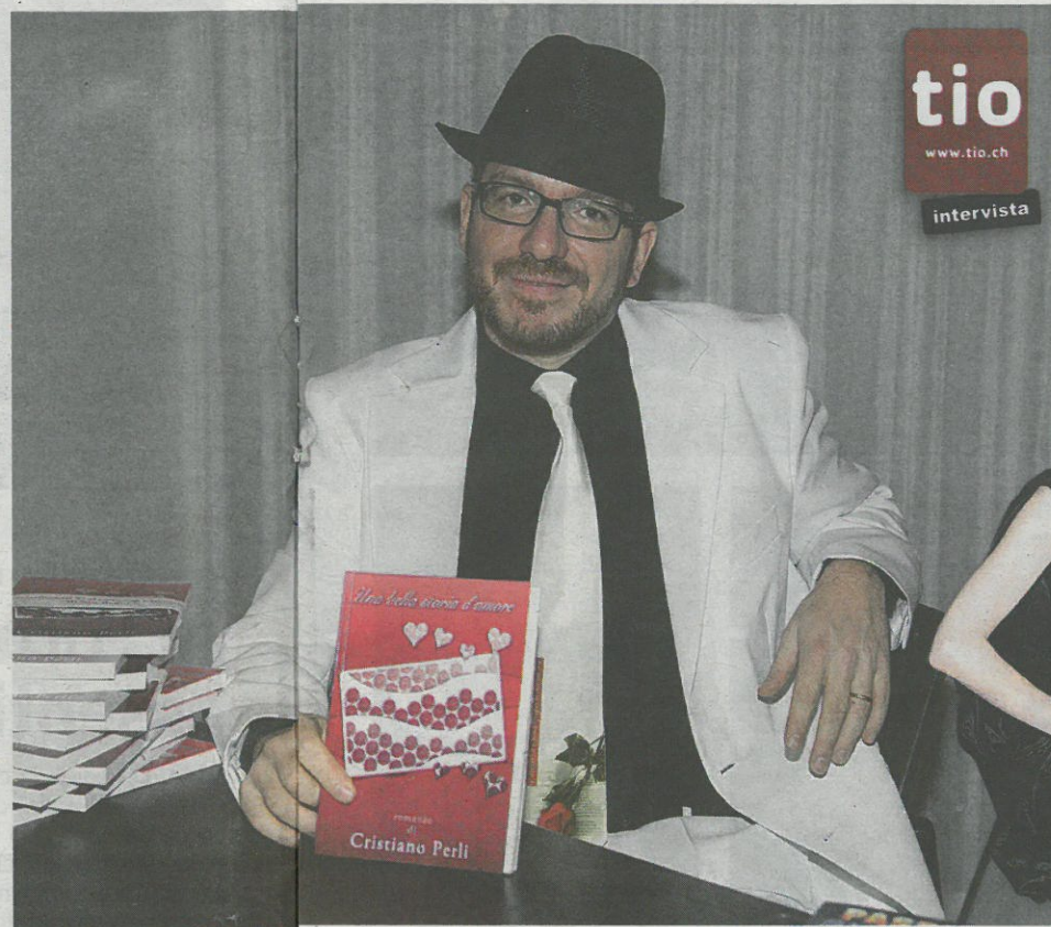
L'anima gemella esi-

«Una bella storia d'amore è il primo romanzo che ho scritto. La sua gestazione è stata abbastanza lunga, tanto da farsi anticipare dai due romanzi ispirati all'Hockey Club Ambrì Piotta. Tutto parte da un concerto di Vasco Rossi a Imola nel 2006. Da qui si sprigionano delle scintille che porteranno poi a infiammare le pagine del romanzo alla disperata rincorsa di personaggi che vogliono, ma non sanno incontrarsi. Una storia vissuta fra Bellinzona e Biasca, passando per Vernate, Imola e i navigli di Milano».