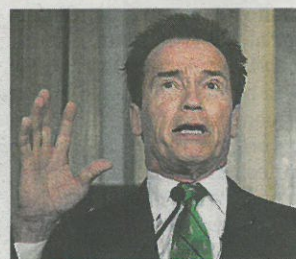
Ha guidato da paura...

alla stampa, ha ammesso di esserne rimasto affascinato sin da giovane. «Ho sempre voluto guidarne uno, così ho approfittato del servizio militare in Austria per imparare come si fa». "The Last Stand" uscirà nelle sale della Svizzera italiana a fine gennaio.