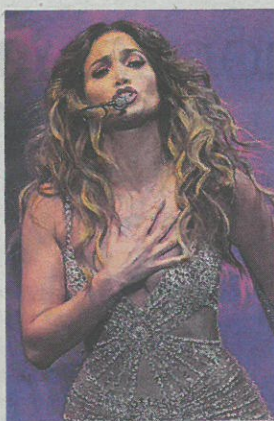
Occhio al cuore però...