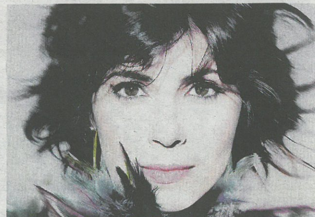
La cantante vola alto.

Jepsen (10°). Tra gli artisti presenti nella Top 100 con più brani in attivo spiccano Tiziano Ferro e Biagio Antonacci che piazzano rispettivamente quattro e tre canzoni.